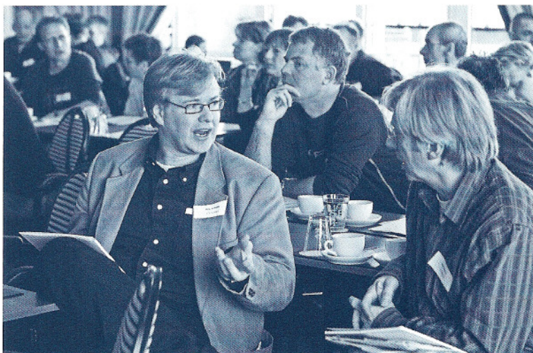
Deelnemers discussiëren op studiedag in Cuijk.

In juli 2004 startte de grensoverschrijdende samenwerking Hand in Hand in Nordrhein-Westfalen, Limburg, Noord-Brabant en Gelderland. Men richtte zich daarbij op drie doelgroepen: cliënten, medewerkers en deskundigen. "Door onze kennis te bundelen en ervaringen uit te wisselen, kunnen wij veel gerichter